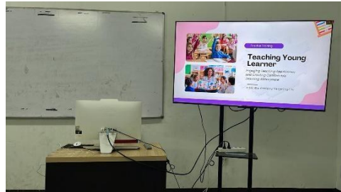
Gambar 1 Kegiatan Pelatihan

Pada sesi praktis, guru mendapatkan pengalaman langsung melalui simulasi Games, Activities, and Techniques to Maximize Young Learner Engagement . Kegiatan ini mencakup seperangkat permainan dan teknik pengajaran yang dirancang untuk mendukung pembelajaran kosakata dan tata bahasa secara kontekstual, tanpa mengurangi unsur kesenangan. Melalui praktik ini, guru memahami bahwa pembelajaran grammar dapat diintegrasikan secara alami melalui aktivitas bermain, sehingga lebih sesuai dengan kebutuhan belajar anak-anak.